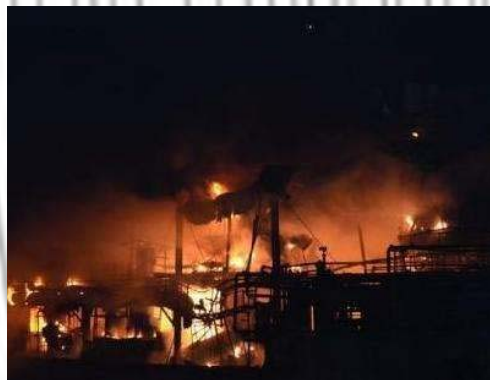
吉林东丰一机械公司发生爆炸引起火灾

在此案中，该机械厂履行了 危险程度增加的公告义务 ，保险公司要求增加保费，被拒绝后，保险公司理应解除保险合同，并通知投保人，但保险公司怕失去业务，心存侥幸，拖而不决，应视为保险合同继续有效，当发生火灾事故时，保险公司却因投保人未增交保费为由拒赔，显然违背了保险合同的 最大诚信原则 ，损害了投保人的利益。最终法院判决保险公司承担本次事故的全部损失。