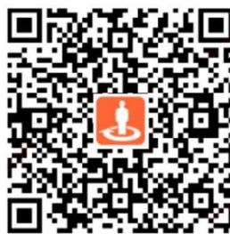
二维码名称：平安安诊无忧·百万医疗险